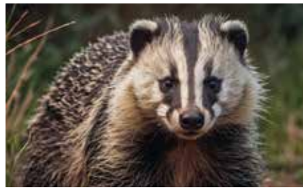
Dachs; © Mustafa/AdobeStock

Produkte, die Dachsfett/-öl enthalten, können grundsätzlich als Lebensmittel vermarktet werden, sofern keine Angaben zur