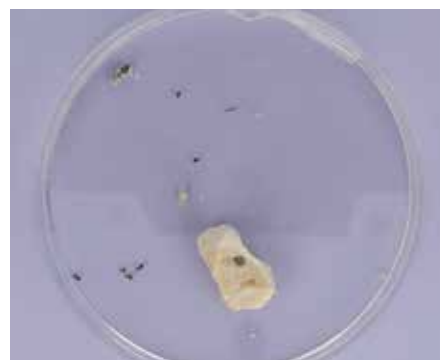
Mikroskopie Kaschk mit Fremdkörpern

Hintergrund dieser getrockneten Darreichungsform von Joghurt ist, dass in ländlicheren Gegenden im arabischen Raum eine sachgerechte Lagerung von Joghurt aufgrund fehlender Kühlmöglichkeiten nicht möglich ist. Die Trocknung des Joghurts stellt demnach eine wichtige Konservierungsmethode dar.