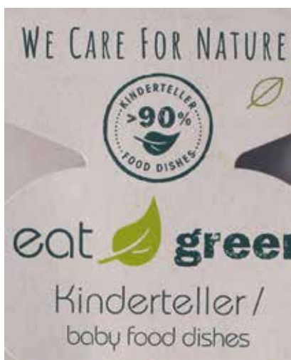
Abbildung 1: Etikett einer Probe; © CVUA Stuttgart

Unsere Untersuchungen zeigten jedoch, dass für die Herstellung dieser Innenfolien