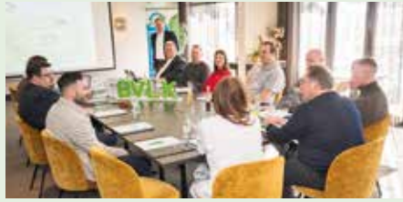
Teilnehmer des Treffens